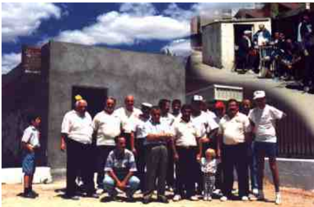
Foto de la nueva caseta tomada en 1997, en el ángulo superior la caseta anterior (1987)

Ex-Presidente del Club Calva Alcalá de Henares