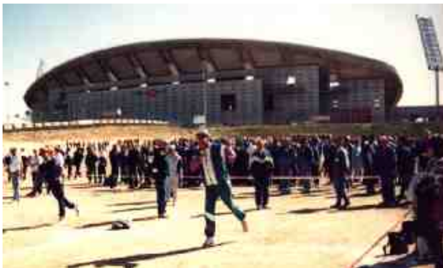
I-Juegos Populares (1995) con gran participación de jugadores y público

EL CALVERO-90 N°8, recoge en las páginas 6 y 7 el Primer encuentro de Juegos Populares en el Estadio de la Comunidad de Madrid (La Peineta). El 23 -4- 95, con más de dos meses de antelación, fue invitada, por la persona encargada de la coordinación de este evento, la Federación Madrileña de Calva para participar en el mismo. Por esta razón, en la Asamblea General del 2-2-95, al confeccionar el calendario de competiciones para la