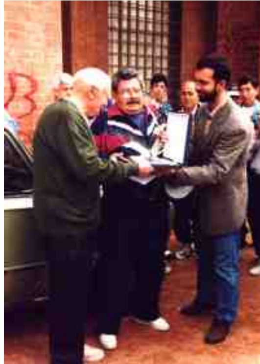
Momento de la entrega de la placa conmemorativa

Cambiamos impresiones. - Me llamaste la atención. No sabía de quien se trataba.